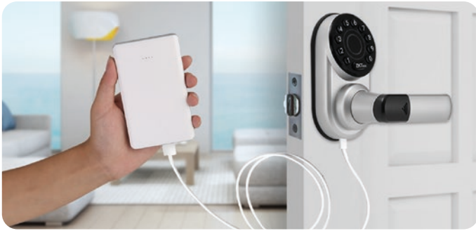
Puerto Micro-USB para Aperturas de Emergencia