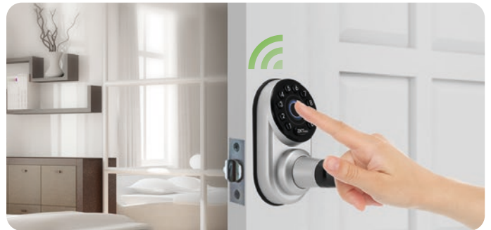
Sensor de Huella Digital Capacitivo (sólo para ML300)