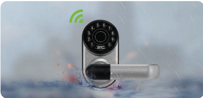
Resistencia a Condiciones de Semi-Exteriores (sólo para ML200 pero no en ambientes salinos)