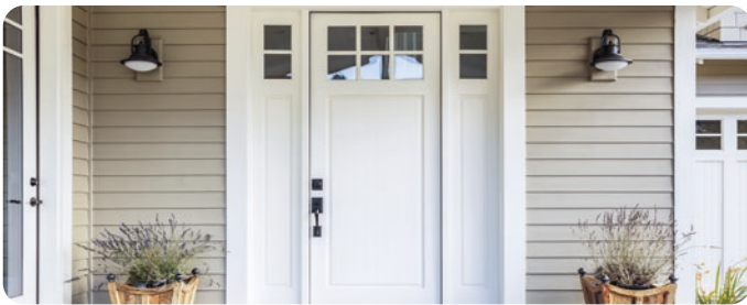
Entradas Principales (sólo para ML200)*