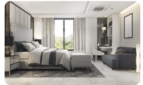
Servicios de Renta Temporal