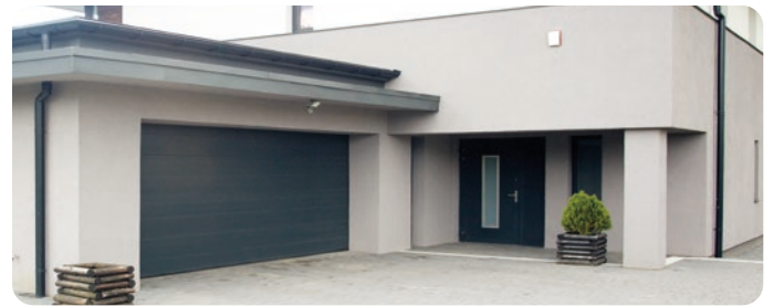
Entradas de Garage (sólo para ML200)*

*No se recomienda la instalación de productos con sensor de huella digital (ML300) en espacios donde el sol o el agua puedan tener un contacto excesivo.