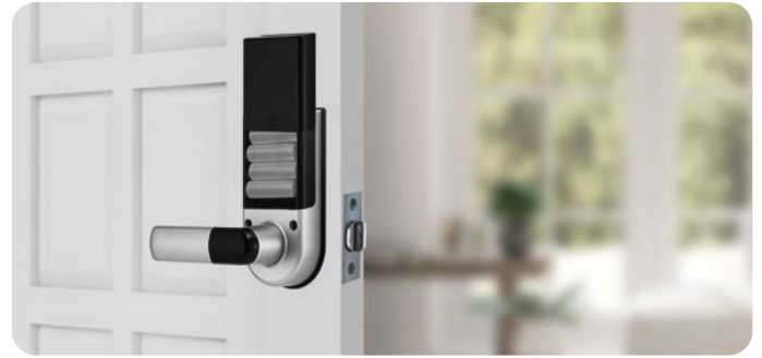
Bajo Consumo de Energía